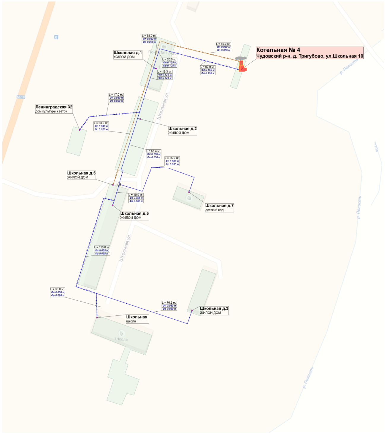
Рисунок 1.1. Схема тепловых сетей котельной № 4 д.Тругубово